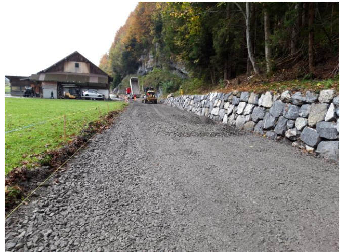
TS1 am 23.10.2024: Planie resp. Vorbereitungsarbeiten für Belagseinbau Tragschicht im Balm in Richtung Stützli.