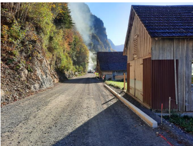
TS1 am 29.10.2024: Planie beim Brennhüttli vor dem Belagseinbau.