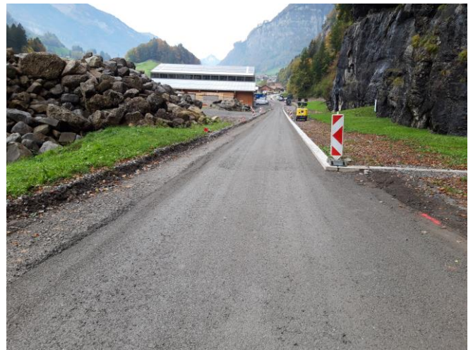
TS 2 am 16.10.2024: Planie vorbereitet am Tag vor dem grossen Belagseinbau.