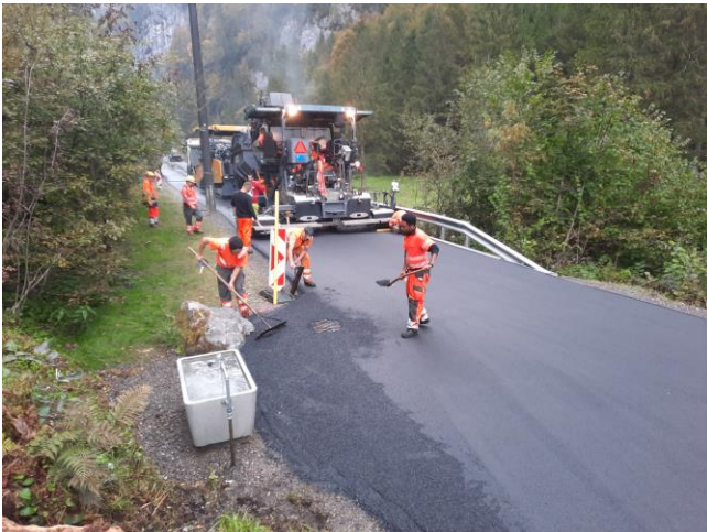
TS 2 am 08.10.2024: Belagsarbeiten Deckbelag zwischen Steinweid und Zwingsbrücke.