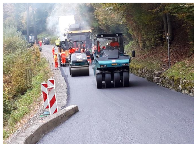
TS 2 am 17.10.2024: Einbau Tragschicht im Bild oberhalb Höch Murä. Es wurden über 1000 Tonnen Belag eingebaut.