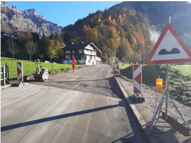
TS1 am 29.10.2024: Belagsarbeiten Tragschicht zwischen Balm, schlichenden Brünnen Brücke bis Stützli, Starzlenbachbrücke