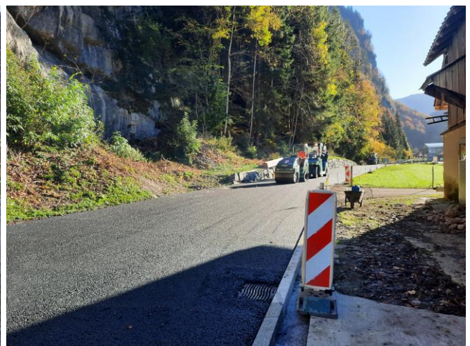
TS1 am 29.10.2024 Belagseinbau Balm.