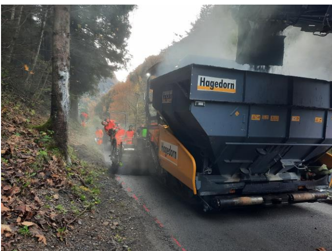
TS 2 am 17.10.2024: Einbau Tragschicht zwischen Cholplatz und Gewerbe Balm. Über 50 Lastwagen haben den Asphalt transportiert. Einbau von 7:30- 19:00 Uhr.