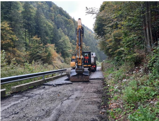
TS 2 am 08.10.2024: Parallel zum Einbau Deckbelag wird der bestehende Belag beim Herrgottstutz abgebrochen.