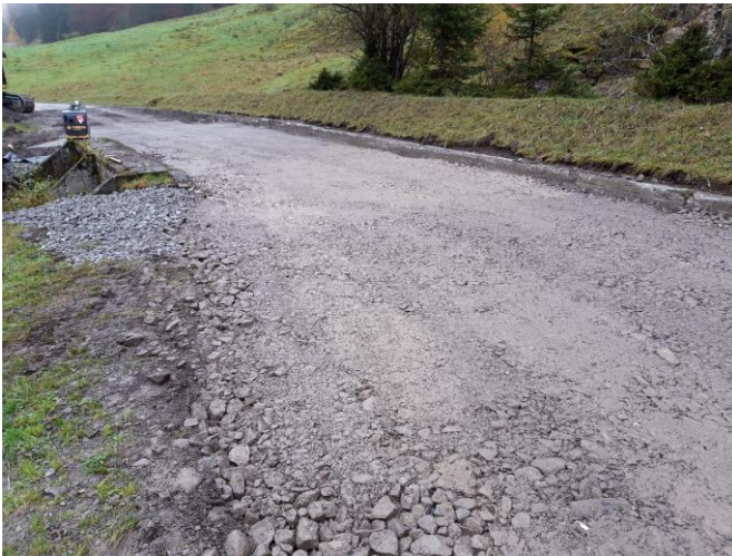
TS2 am 23.10.2024: Foundation im Abschnitt Seeberg / Brünnen erstellen. Belagseinbau Tragsicht Ende Oktober 2024.