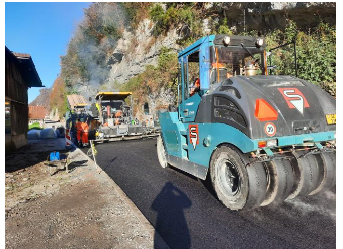
TS1 am 29.10.2024: Belagsarbeiten Tragschicht mit mehreren 100 Tonnen bituminöser Asphaltbelag.