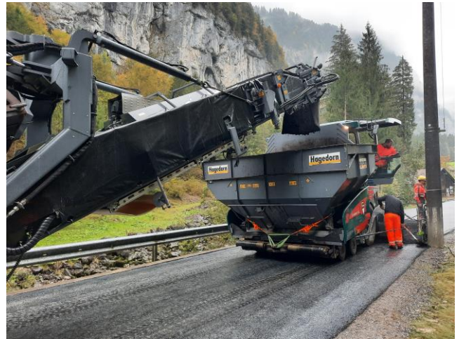
TS 2 am 08.10.2024: Im Bild Einbau bei der Euschplanggen mit Fertiger.