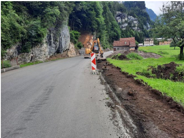
TS1: Strassenverbeitungen, Geländeadjustungen Balm in Arbeit