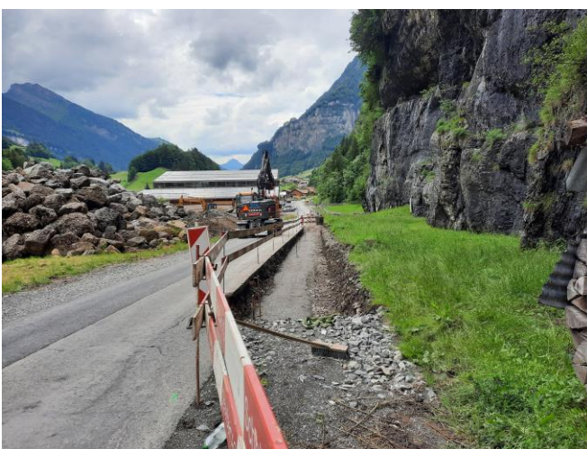
TS1: Bauarbeiten Schafannahmestelle Balm, Foto vom 12.6.24