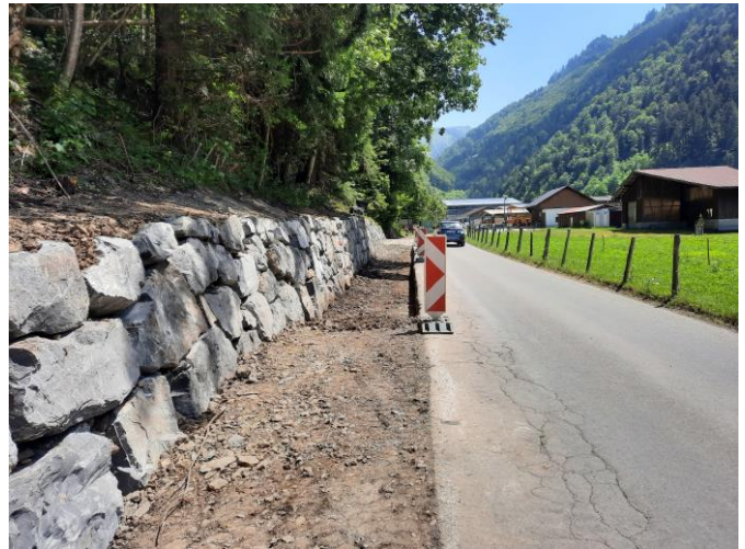
TS1: Trockensteinmauer Balm abgeschlossen