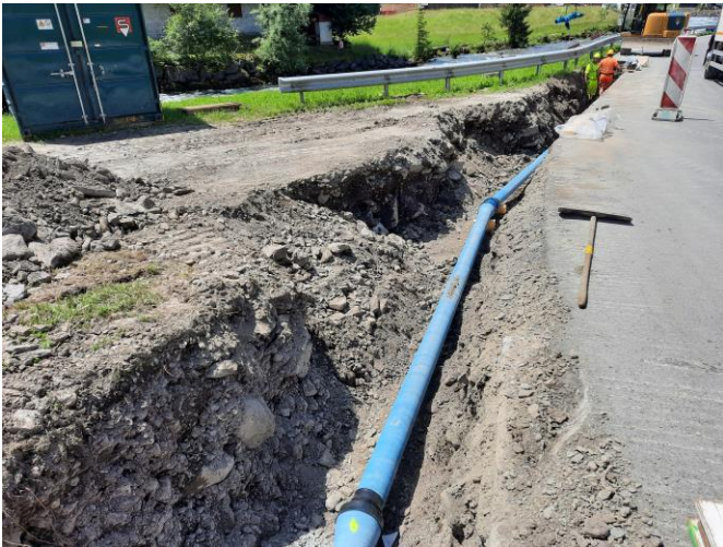
TS 1 TWL im Stützli- Balm: Verlegearbeiten Trinkwasserleitung die letzten Wochen