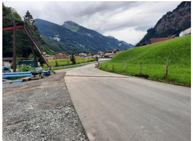
TS1: Querleitungen Entwässerung Stützli in Arbeit