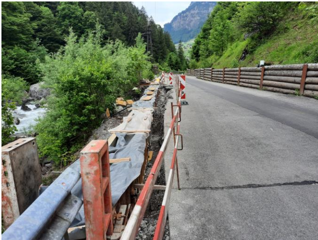
TS2: Betonieren Randborde unterhalb Herrgottstutz abgeschlossen