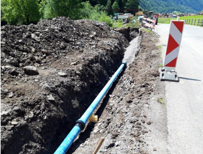
TS1: Ersatz Trinkwasserleitung zwischen Starzlenbrücke und Balm 1, Anfang Juni