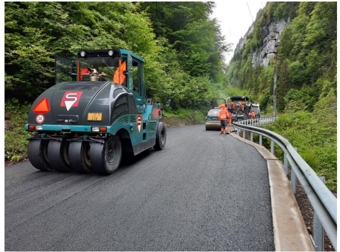
TS2: Belagseinbau Tragschicht zwischen Euschen- und Zwingsbrücke bis Cholplatz, Ende Mai