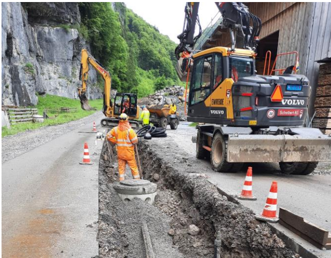
TS 1/2 TWL im Balm: Zusammenschluss der Wasserleitung durch die WGM, Ende Mai