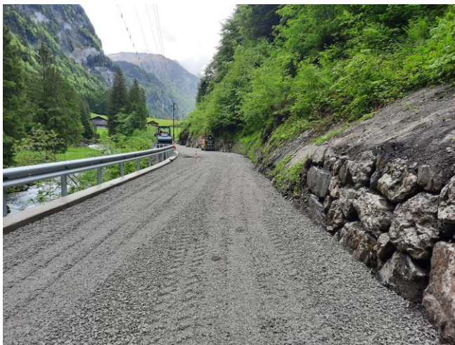
TS2: Planie vor Belagseinbau und Montage Leitschranke zwischen Euschen- und Zwingsbrücke