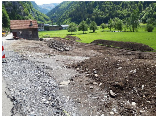
TS1: Auffüllungen Strassenverbreiterung im Balm erstellen