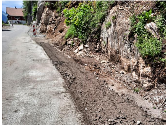
TS1: Verbreiterungen Strasse im Balm