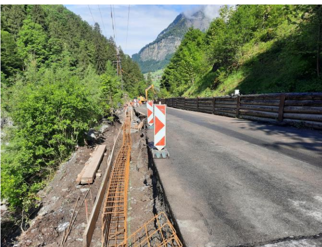
TS2: Randborde laufend betonieren in Etappen unter Herrgottstutz