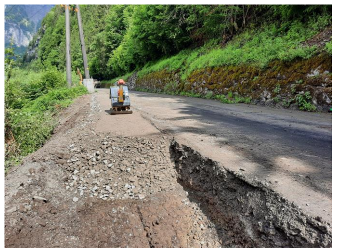
TS2: Bauarbeiten an Engstellen vor Aufhebung der Tagessperrungen, Mitte bis Ende Mai