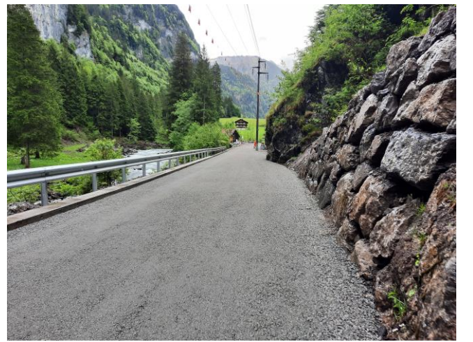
TS2: Trockensteinmauern instandstellen und Randborde betonieren zwi. Euschen- und Zwingsbrücke