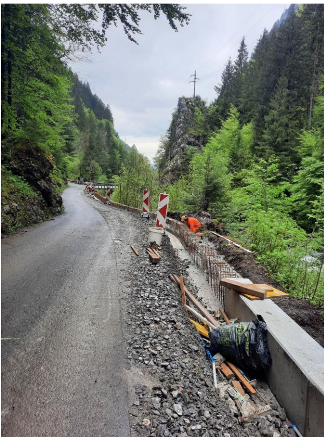
TS2: Schalung für neue Randborde zwischen der Zwings- und Euschenbrücke laufend in Arbeit bis nach Mitte Mai