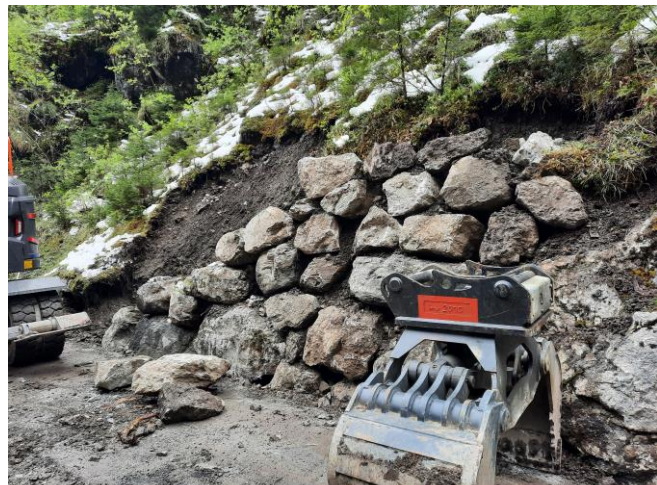
TS2: Trockensteinmauern zwischen der Zwings- und Euschenbrücke instandstellen