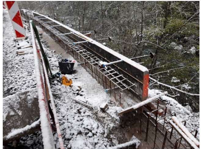
TS2: Schalung für neue Randborde zwischen der Zwings- Euschenbrücke laufend in Arbeit (Mitte April)