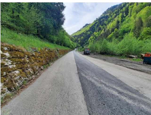
TS2: Prov. Belagseinbau zwischen Herrgottstutz bis vor Höch Murä am Fr. 03.05.2024