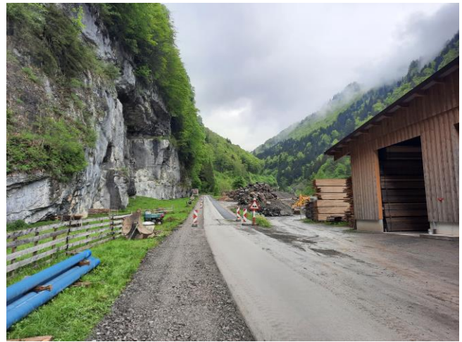
TS2: Prov. Belagseinbau zwischen Höch Murä bis Balm (Kopp Fenster) am Mi. 08.05.2024