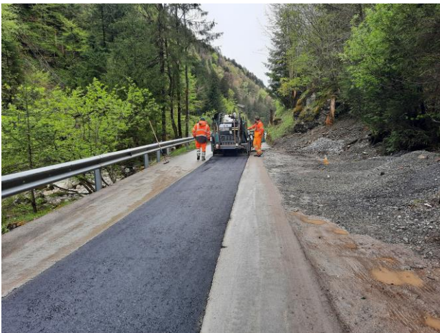
TS2: Prov. Belagseinbau zwischen Cholplatz und bis unter Herrgottstutz am Fr. 19.04.2024