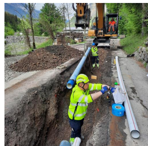
TS2 Steinbruch Höch Murä: Verlegen der Wasserleitung durch die WGM am Mi. 08.05.2024.