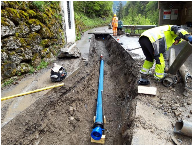
TS 2 Herrgottstutz: Verlegen der Wasserleitung durch die WGM