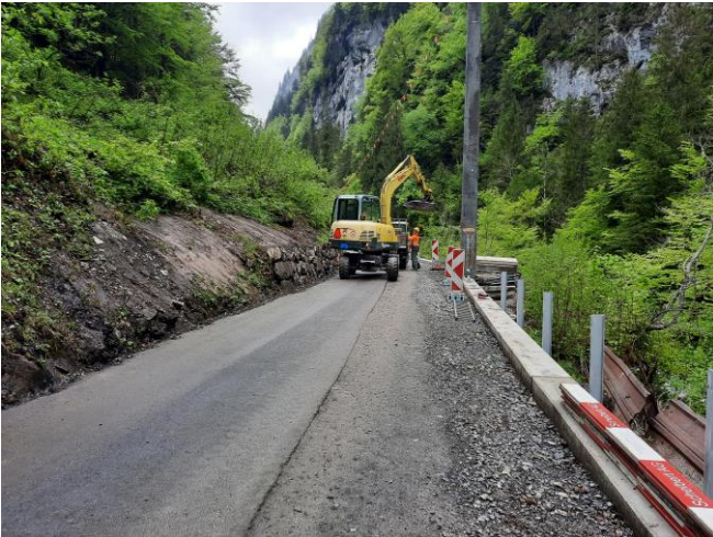
TS2: Leitschranke auf Randborde zwischen der Zwings- und Euschenbrücke laufend in Arbeit